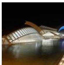
Horario de verano: Una hora menos de vida pero doce millones de euros de ahorro