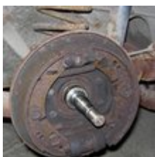
Cuando el coche se avería por falta de uso