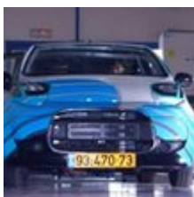
Completan 1.600 km con una batería de aluminio, agua y aire