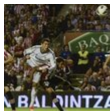
Cristiano Ronaldo apaga el trueno creado por el Athletic